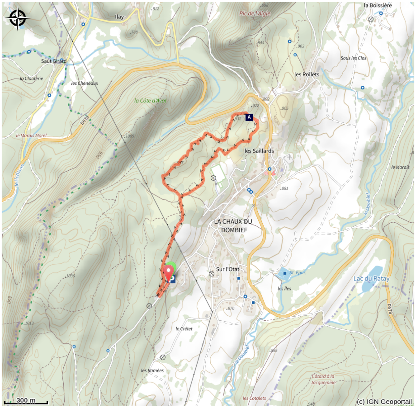
Vue sur le Pic de l'Aigle (A)